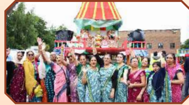
શ્રી ક. સ. સ્વામિનારાયણ મંદિર, કેન્ટન હેરો મંદિર દ્વારા આયોજિત લંડનમાં ભવ્ય રથયાત્રા મહોત્સવ – હેરો કેન્ટન યુ. કે.