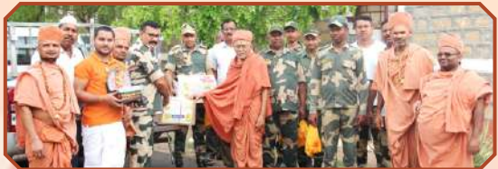
ભુજ પ્રસાદી મંદિરે ખારેક ઉત્સવનો પ્રસાદ ધર્મસ્થલા, ભેડિયાબેટ, હરદોહી બોર્ડર ઉપર દેશની સેવા કરતા સૈનિકોને પ્રસાદ પહોચાળાથો.